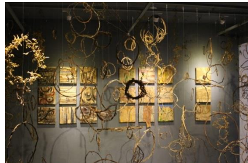
2020 - 滲透：花蓮青年藝術培力展