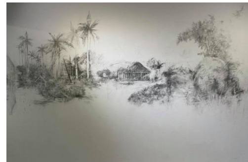
2021 - 在 · 不在 花蓮青年藝術培力展