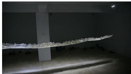
2018 年杉原幸信(Sugihara Nobuyuki)