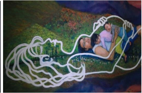
2019 - 在路上：花蓮青年創作培力展