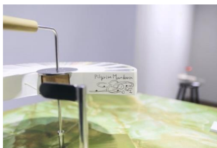
2019 年蓮沼昌宏(Masahiro Hasunuma)